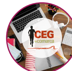
Taula Comarcal d'Esports