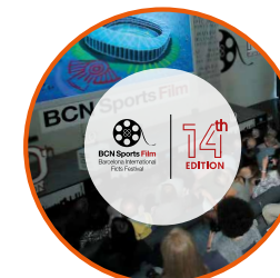
BCN Sports Film Festival