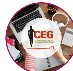
Taula Comarcal d'Esports