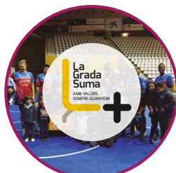
La Grada Suma