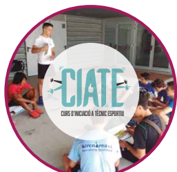
Curs Iniciació a Tècnic Esportiu