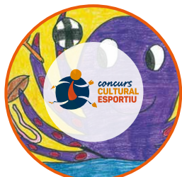
Concurs Cultural i Esportiu