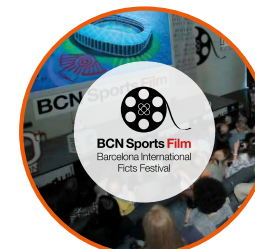
BCN Sports Film Festival