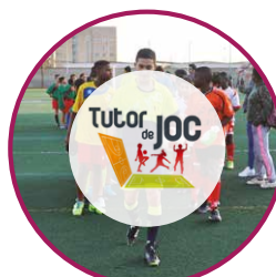
Escola de Tutors de Joc