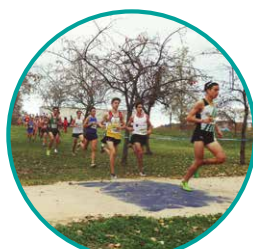
Circuit Gironí de Cros