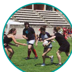
Interinstituts de Rugbi