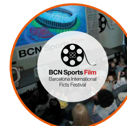
BCN Sports Film Festival