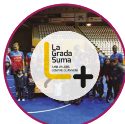
La Grada Suma