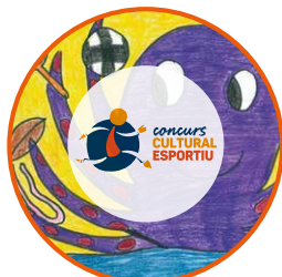
Concurs Cultural i Esportiu