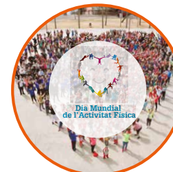
Dia Mundial Activitat Física