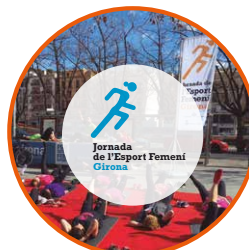
Jornada de l'Esport Femení