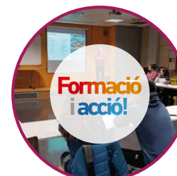
Formació i Acció