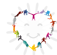
Dia Mundial de l'Activitat Física